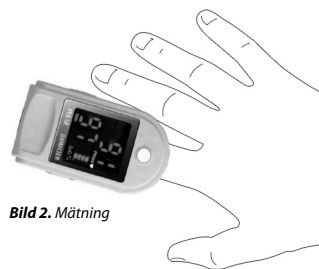
Bild 2. Mätning

2. Placera fingret i instrumentet enligt bild 2. Nageln ska vara placerad uppåt på skärmsidan.