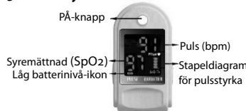
Bild 1. Symbolerna på Apteq-pulsoximeters skärm